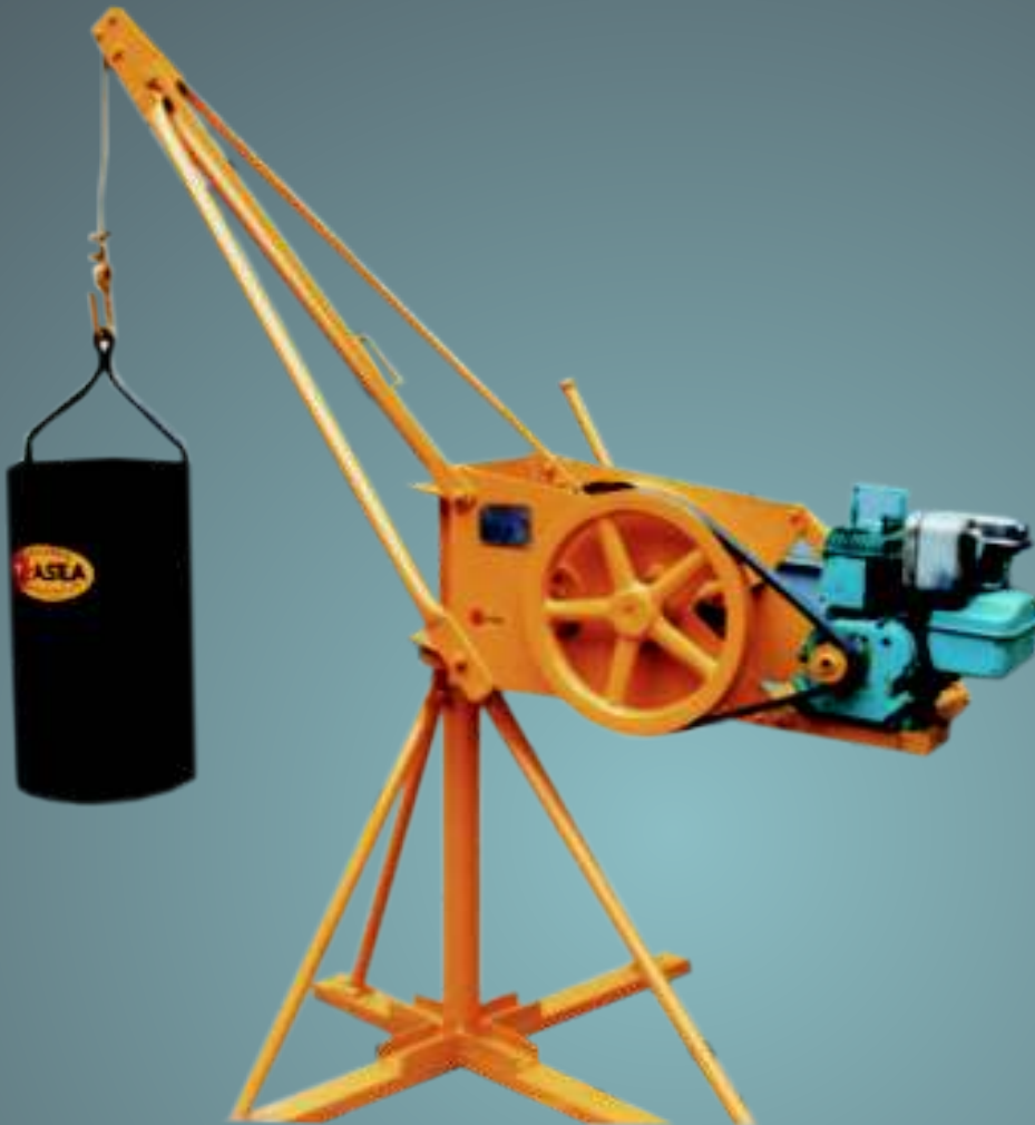
Pluma Grúa Modelo P-250 y P-300